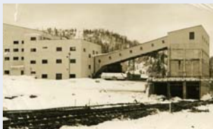
羽幌本坑 選炭工場(左)・貯炭場(右)