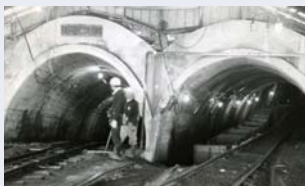
上羽幌坑 二坑本斜坑口