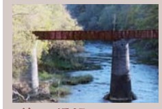
第一橋梁(春水橋より)