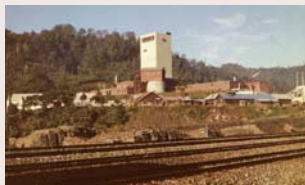
羽幌本坑 運搬立坑(中央)

昭和36年着工、昭和40年6月に完成しました。立坑上部に巻き上げ機を備えた日本で二ヶ所しかない珍しい運搬立坑です。総工費17億円。立坑は垂直に掘り下げた坑道のことで、基本的にエレベーターと同じです。建物の高さは地上40m、坑底まで地下512m。