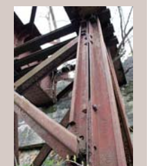
第三橋梁(働使橋より)

橋から望む炭砒鉄道の橋梁 石炭運搬のために、昭和15年に開始された鉄道敷設工事は、戦時下の鋼材不足のため困難をきわめ、中古の橋桁を集めました。このことから橋桁は不揃いとなっています。