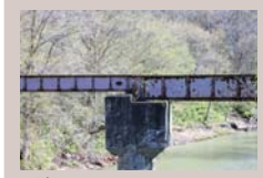
第二橋梁(鶴亀橋より)

橋から望む炭砒鉄道の橋梁 石炭運搬のために、昭和15年に開始された鉄道敷設工事は、戦時下の鋼材不足のため困難をきわめ、中古の橋桁を集めました。このことから橋桁は不揃いとなっています。