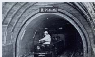
築別坑 築別本坑坑口

立坑とは異なる斜坑入口です。ここから水平又は斜めに掘削し、炭層に至ります。貨車を巻き上げ機や電車で引き上げる方式でした。現在は入口をコンクリート等で密閉されています。