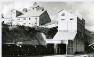
築別坑 選炭工場(左)・貯炭場(右)