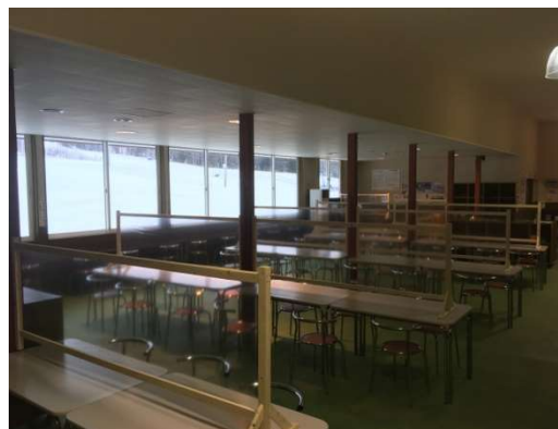
コロナ感染症予防対策