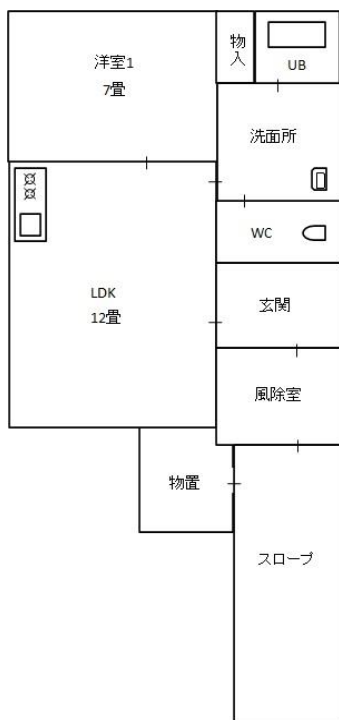
幸町団地 ※ 左右逆タイプもあります