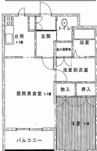
若葉団地 ※ 左右逆タイプもあります