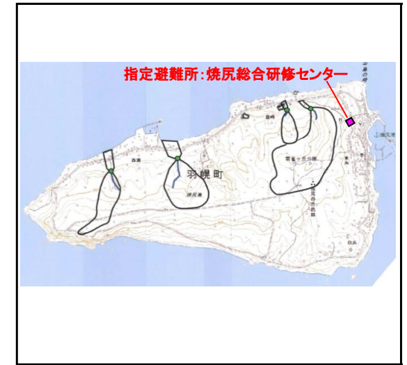
位置図 (図の上位が北を示す)