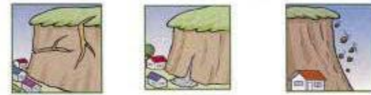
がけに割れ目が見える。 がけから水が湧き出ている。 がけから小石がぱらぱらと落ちてくる。

次のような現象を察知した場合は、土砂災害が直後に起こる可能性があります。直ちに周りの人と安全な場所へ避難するとともに、関係機関へ通報して下さい。