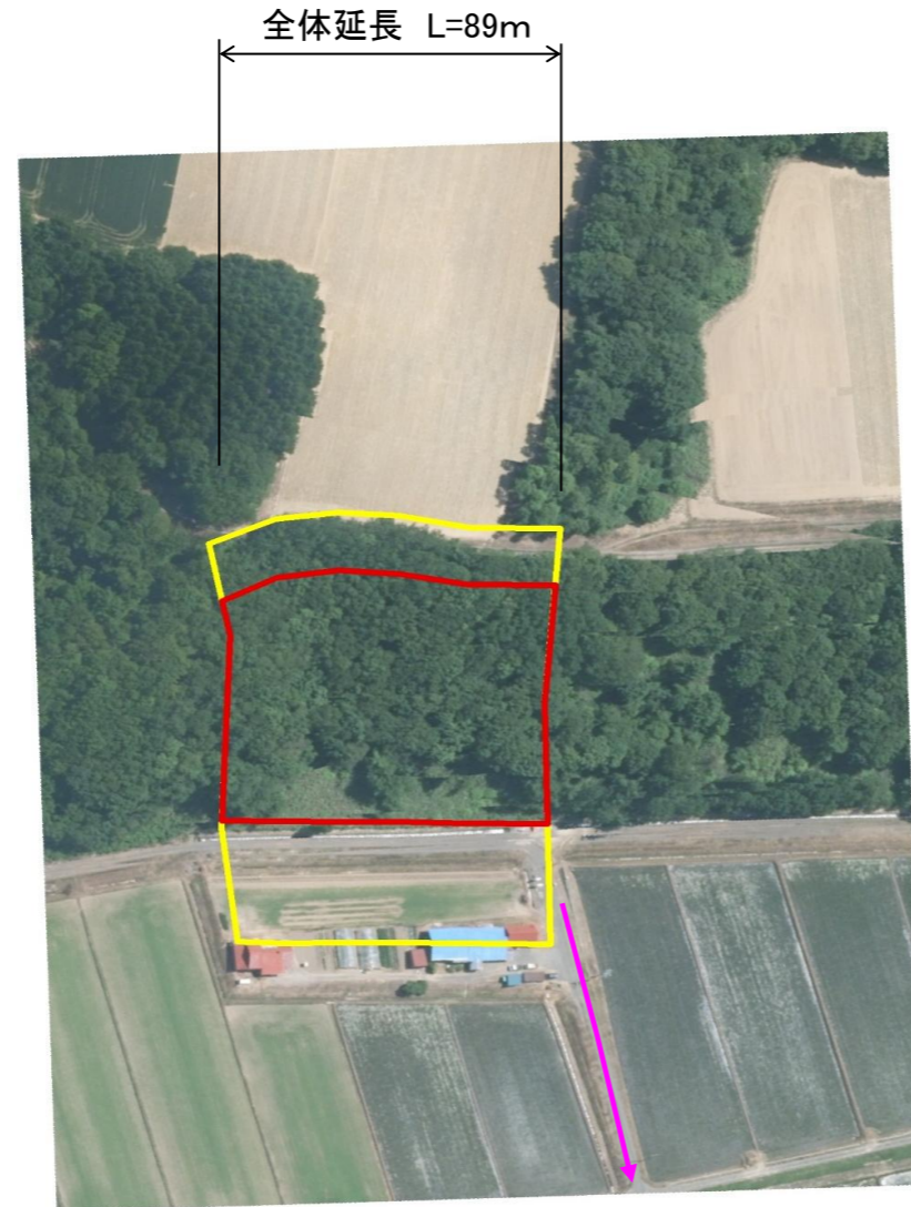
指定避難所:羽幌町立中央公民館

※本マップは、各項目の表示例を示したものです。 本マップで表示された地区の指定状況等を忠実に反映したものであるとは限りません。