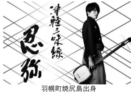
羽幌町焼尻島出身

日時 9月20日(水) 正午開場/午後1:30式典開始 (正午までは会場に入れません) 会場 中央公民館大ホール 対象 町内在住の65歳以上の方(同伴の家族含む) 余興 忍弥(津軽三味線)ほか