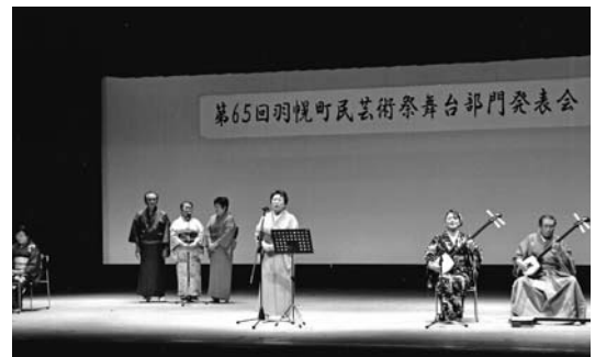
第65回羽幌町民芸術祭舞台部門発表会

会員は4名ですが子供から寿年まで趣味を共にする仲間が三味線と歌で感動し、楽しい時間を過ごしております。興味のある方は中央公民館までお問い合わせください。お待ちしております。