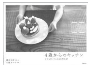
4歳からのキッチン 渡辺 ゆき 著

2011年6月、小笠原は世界自然遺産に登録されました。「東洋のガラパゴス」とも呼ばれる小笠原のイルカやクジラ、海鳥が集う美しき楽園をまるごと楽しめる写真集です。