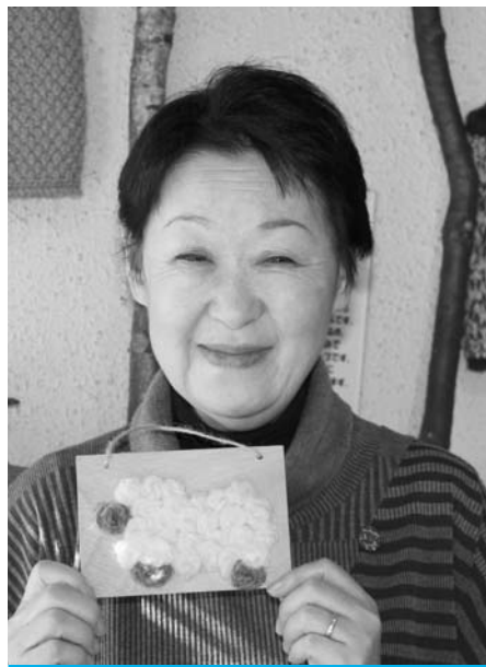
綿羊工房(アイランドサフォーク)代表