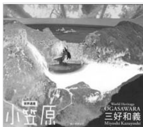
世界遺産 小笠原 三好 和義 著

2011年6月、小笠原は世界自然遺産に登録されました。「東洋のガラパゴス」とも呼ばれる小笠原のイルカやクジラ、海鳥が集う美しき楽園をまるごと楽しめる写真集です。