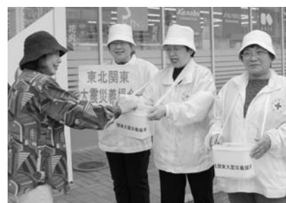
▲日赤奉仕団は、3月から9月まで毎月1回町内5ヶ所で街頭募金を計画。長期的に活動を実施。団員からの募金と合わせ、3回目の5月29日で寄せられた総額は、560,517円になっています。