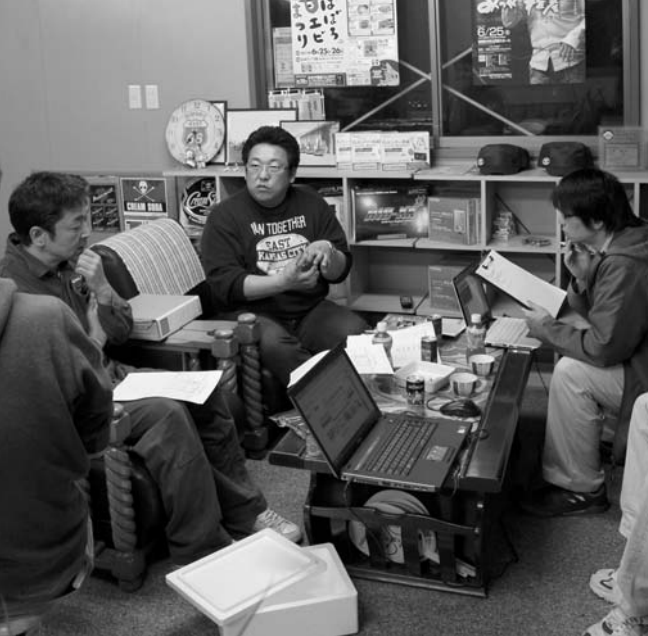
毎回、夜遅くまで熱のこもった打ち合わせを重ねている実行委員会

まつりの主役は、なんといっても旬の「甘エビ」。しかも、通常、土曜日は出漁しないエビ籠漁船にムリをいってお願いし、甘エビまつりだけのために活きた状態で会場に運ばれる鮮度抜群のエビ(鮮エビ)です。ひとり1箱(2キロ入り)限定で1500箱を浜値でどーんと提供します。そのほか、会場では、オリジナルの甘エビ料理を味わえ