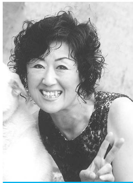
北るもい漁協 羽幌女性部 部長