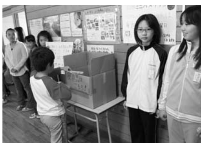
▲羽幌小学校では、被災地の子ども達に文房具を贈るうと、5月9日から31日まで児童会の子ども達が毎朝児童玄関で未使用の文房具を集める取り組みを実施しました。