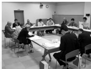
さまざまな意見や提言が出されたまちづくりはぼろ会議

今後は、現在募集している町民のみなさんの意見を踏まえ、町総合振興企画調査審議会での審議・答申を経て計画案を決定。4月からのスタートを目指します。