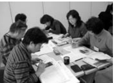
献立のたて方も学びます