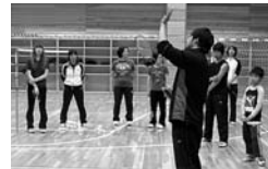
補助金を利用して昨年5月に天売島で開かれたバドミントン教室

町に申請後、人づくり委員会の内容審査・選考を経て町が決定します(人づくり委員会は町民のみなさんで構成された組織です)