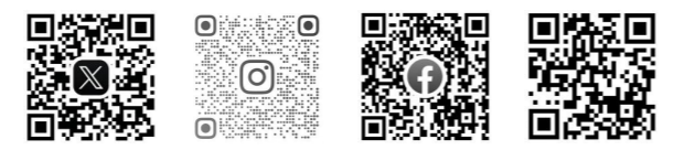
X(旧Twitter) インスタグラム フェイスブック 病院ホームページ

病院の診療に関する最新の情報は、病院ホームページや公式SNSで案内しています。ぜひフォローをお願いします。