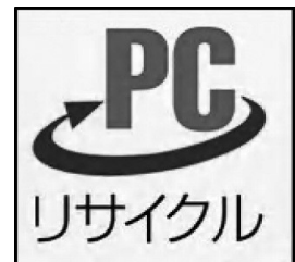
「PCリサイクルマーク」

※ 「PCリサイクルマーク」シールが送付されている場合は、家庭用パソコンにシールを貼付し廃棄してください