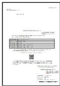
資格情報のお知らせ

資格情報のお知らせ(A4サイズ)が届いた方であっても、何らかの理由によりマイナ保険証での受診が困難であると申請された方には、資格確認書を交付します。