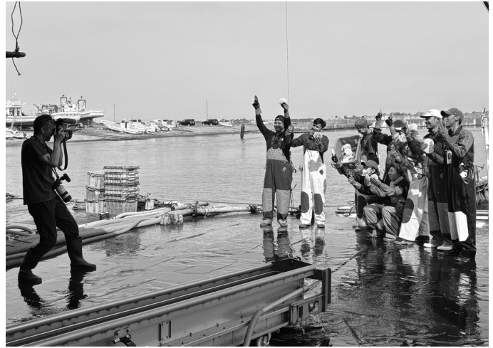
取材の光景(ご協力いただいたみなさま、ありがとうございました)