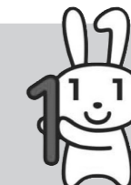
マイナンバーキャラクター 「マイナちゃん」

マイナンバー(個人番号)は、平成28年1月以降、福祉や健康保険などの社会保障や税、災害対策の3つの分野で使用します。すでに皆様のご自宅にもマイナンバーが記載された「通知カード」が郵送されていると思いますが、今月号では実際の利用場面や手続きする際の留意点についてご説明します。