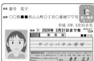
表面：氏名、住所、生年月日、性別、本人の写真