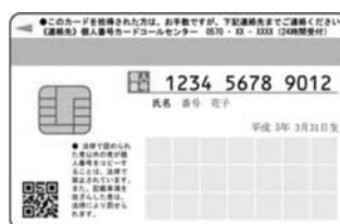
裏面：マイナンバー等が記載、ICチップ搭載