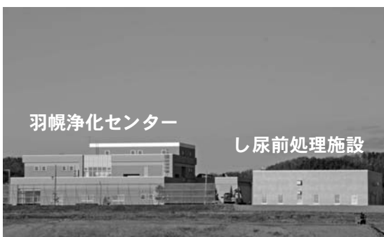
羽幌浄化センター