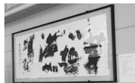
ロビーに展示中の作品