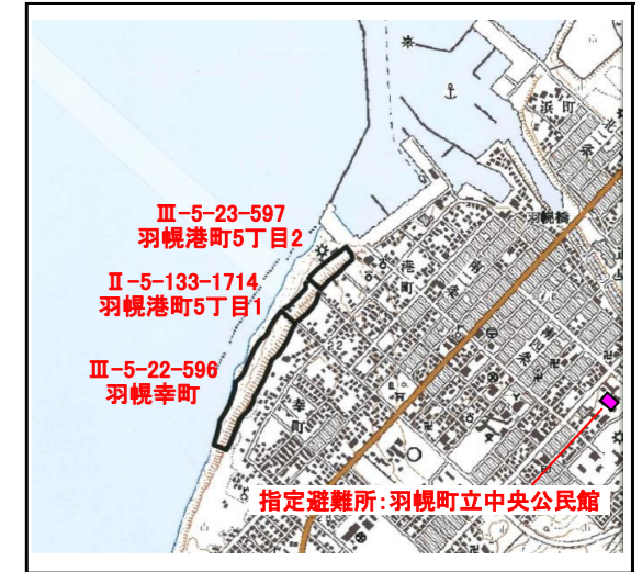
位置図 (図の上位が北を示す)