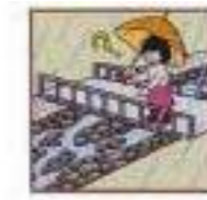
雨が降り続けているのに川の水位が下がる。