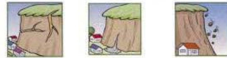
がけに割れ目が見える。 がけから水が湧き出ている。 がけから小石がぱらぱらと落ちてくる。

次のような現象を察知した場合は、土砂災害が直後に起こる可能性があります。直ちに周りの人と安全な場所へ避難するとともに、関係機関へ通報して下さい。