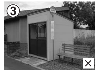
③9/30最終便で廃止 現停留所・待合所