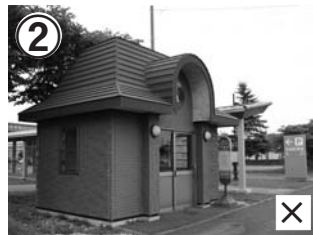
②9/30最終便で廃止 現停留所・待合所