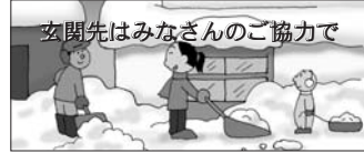
玄関先はみなさんのご協力で

雪出しは、交通事故の原因となり非常に危険です。また、歩道に物を置くと、除雪作業の障害になります。