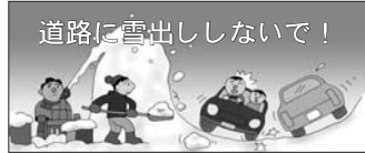
道路に雪出ししないで！

路上駐車は、除雪作業の障害になり円滑な作業の妨げになります。また、交通事故の原因にもなります。