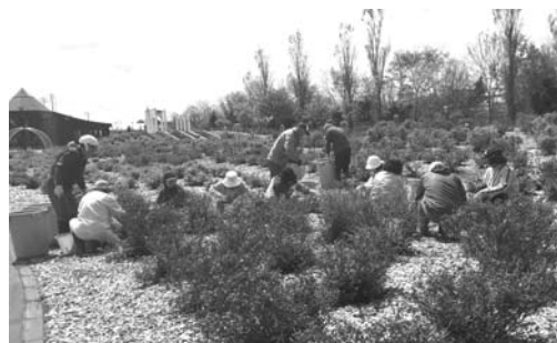
※5/10.24剪定作業の様子。徐々に葉が増えてきました。

➡ ボランティアの申込・お問い合わせ 商工観光課観光振興係 ☎ 68-7007 (課直通)