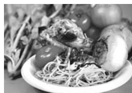
包丁がなかったのですべて原型で作ったパスタです。

かなりの頻度でスポーツをしています。毎回全力で楽しく参加させてもらっているのですが、運動すると動きが女々しくなってしまう体質でして、投げ方は女投げ、ボールが来ると「キヤッ!」「ヤダッ!」などと言いながら避けてしまうタイプで運動能力はかなり低いです。高校時代のテニスの授業では、同性同士では僕が弱すぎて試合が成り立たず、一人だけ女子のグループと試合をしていました。そんな僕にも関わらず島の皆さんは温かく迎え入れてくれました。まずは「サーブを入れる」「ボールに触る」のような大変小さな目標を掲げ、それらを