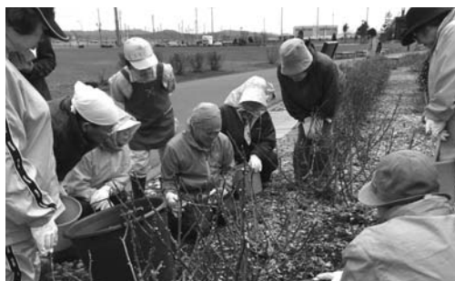
※4/26実施のバラ講習会、剪定講習の様子

➡ ボランティアの申込・お問い合わせ 商工観光課観光振興係 ☎ 68-7007 (課直通)