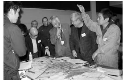
平成23年度は地域住民を交えたワークショップを開催