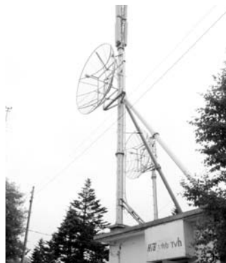
朝日地区のテレビ中継局

地上デジタル放送移行を促進するため、受信施設所有者（NHKなど放送事業者5社）に対し固定資産税相当額を限度として奨励金を交付します。ただし、3年間の限定事業で今年度で終了。