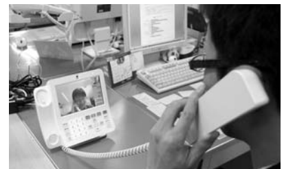
離島地区各世帯に設置した電話機でテレビ電話ができます。

離島地区と市街地区等との情報通信格差の解消を図るために平成22年に整備した離島地区の情報通信基盤施設の管理運営にかかる費用。