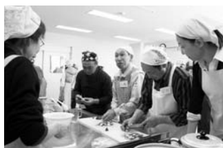
男性のための料理教室

羽幌町食生活改善協議会に補助金を交付し、料理教室の実施など地域の食生活改善、食育推進のための人材育成を支援します。