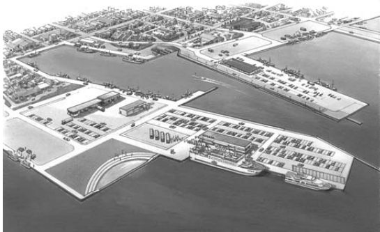
羽幌港湾整備イメージ図

平成25年度中央埠頭供用開始に伴い、移転新築するフェリーターミナルの案内看板を製作、設置します。