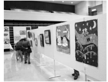
町民芸術祭(展示部門)