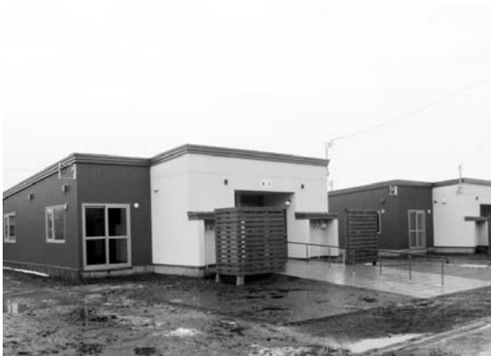
平成23年度から建替が始まった幸町団地