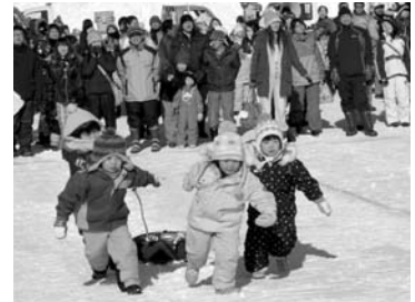
おろろんウィンターフェスティバル