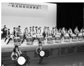
平成23年度は「石川県内灘町」の太鼓グループが羽幌町を訪問。オロロン太鼓と合同演奏会を開催

姉妹都市「石川県内灘町」と文化・スポーツ団体との交流を通して両町の絆を深めます。今年度は羽幌から内灘町を訪問します。