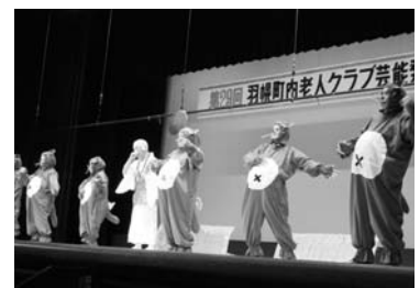
町内老人クラブ芸能発表会