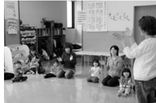
うさこちゃん遊びの広場