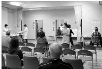
羽幌町が実施している特定健診

身体計測、腹囲測定、問診、尿検査、血圧測定、血液検査、心電図検査、眼底検査、医師診察など