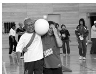
ふれあいスポーツ大会