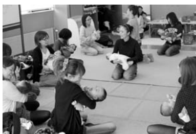
乳幼児育児教室「あいあいサ〜クル」