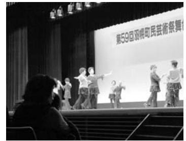
町民芸術祭(舞台部門)