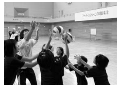
コーディネーショントレーニング