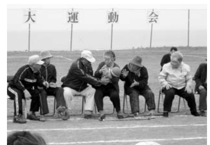
焼尻島民大運動会