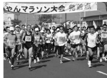
おろちゃんマラソン大会