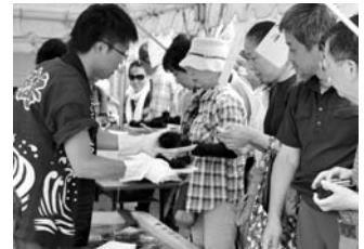
天売ウニまつり（平成23年度）