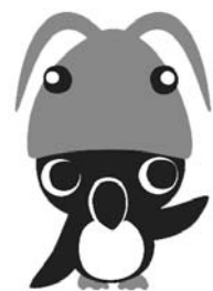
新しい羽幌町のPRキャラクター「オロ坊」

町内経済発展のため、製造業者に対し設備の新設または増設の場合、対象経費の100分の10を助成(限度額200万円)。設備の新・増設に伴い増加した常時雇用する従業員1名に対し10万円を助成(上限額200万円)。