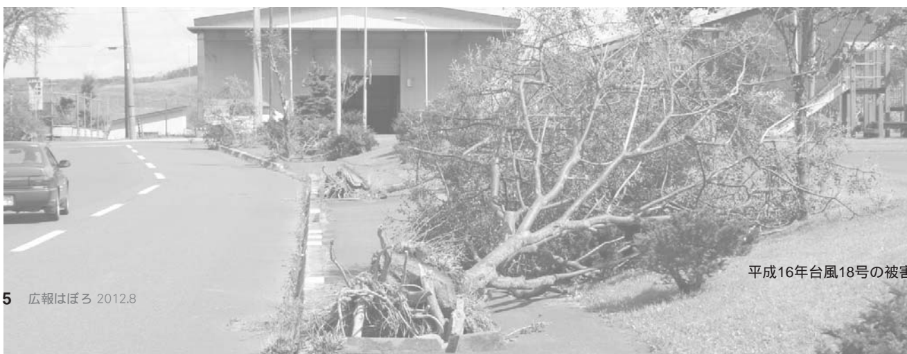
平成16年台風18号の被害