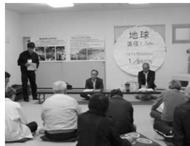
下水道接続地区別説明会 羽幌環境会議にご協力いただき、地球の水資源の大切さの講話のあと、羽幌町の下水道やし尿処理の状況を説明。補助制度について詳しくご説明しました。