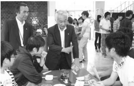
舟橋町長が学生達に羽幌をPR。八十出内灘町長も同行