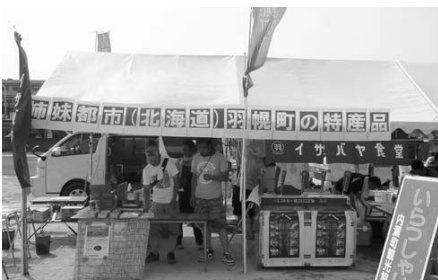
内灘町民夏まつりに出店、羽幌をPR