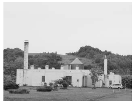
し尿処理施設（北町） 施設の老朽化が心配されているし尿処理場。国道側から、高い煙突のある旧ゴミ処理施設の建物が見えますが、その奥に建っています。

A 現在の施設は羽幌町外2町村衛生施設組合による施設で、平成12年・13年に補修を施し、その後、10年間使用が可能なようにしました。しかし、既にその10年も経過しています。更なる補修を施すには無理な状態で、