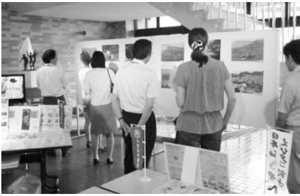
内灘町文化会館ロビーでのPR事業

子どもたちも毎年相互交流しています。今年は、石川教育長を団長として、ミニバスケットボールクラブの小学5、6年生17名と指導者や保護者25名が内灘町を訪問。合同練習や交歓試合で交流を深めました。