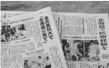
「北國新聞」(左)と「北陸中日新聞」(右)の掲載記事