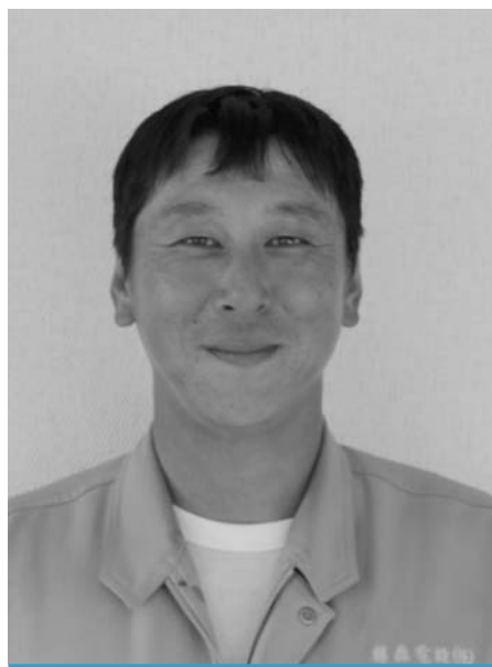
羽幌町加賀獅子保存会 青年部長