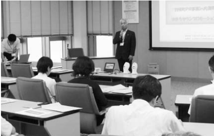
金沢医科大学病院で「はぼろタウンプロモーション」