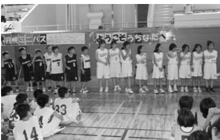
ミニバスケット内灘町での合同練習と交歓試合