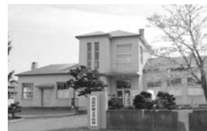
郷土資料館(南町) 開館時間:9~16時、月曜休館