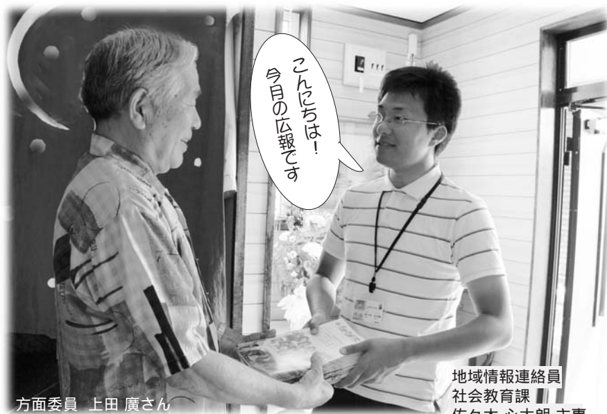
第5方面区への 広報6月号配達の ひとコマ