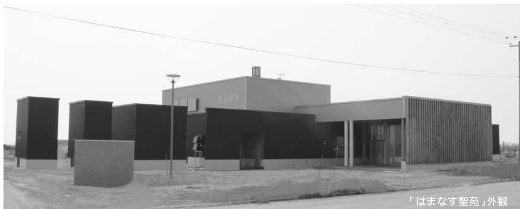
「はまなす聖苑」外観

新しい広域火葬場が完成し、供用開始します。羽幌町外2町村衛生施設組合による施設で、苫前、羽幌、初山別の3町村唯一の広域火葬場です。名称は一般公募で、「はまなす聖苑」と名づけられました。人生の終焉 しゆうえん の場にふさわしい施設として、また、ご遺族のみなさまに心とむよう配慮した施設となっています。