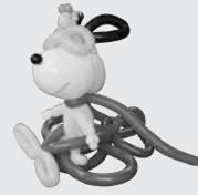
昨年の教室で製作し たスヌービー

風船を使って、動物やキャラクターなどをつくり ます。初めての方から、よりステップアップしたい経 験者まで大歓迎。バルーンアートを子どもたちや地 域の行事などに活かしてみませんか？