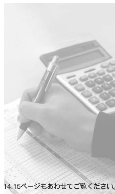
14.15ページもあわせてご覧ください。