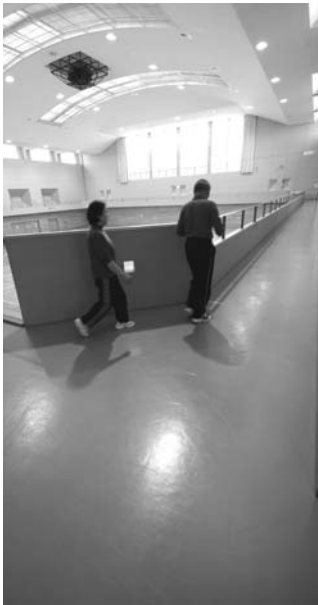
日常生活にウォーキングを少しきつと感じる速度で、目標は一日8000~1万歩。通勤や買い物のついでに、歩く時間や歩数を増やしていきましょう。

厚 生労働省が平成22年に実施した国民健康・栄養調査結果によると、運動習慣のある人の割合は、男性34.8%、女性28.5%でした。みなさんは運動習慣がありますか。今月は、高血圧の予防・改善に大切な運動をテーマに考えてみましょう。 1回30分以上の運動を週2日以上実施し、1年以上継続している人 運動が血圧を下げる効果 高血圧症や血圧が高めな場