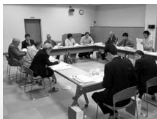
さまざまな意見や提言が出されたまちづくりはぼろ会議

今後は、現在募集している町民のみなさんの意見を踏まえ、町総合振興企画調査審議会での審議・答申を経て計画案を決定。4月からのスタートを目指します。