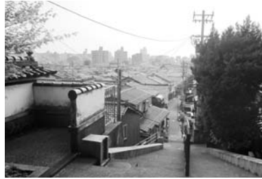
風情のある石川県内の街並み