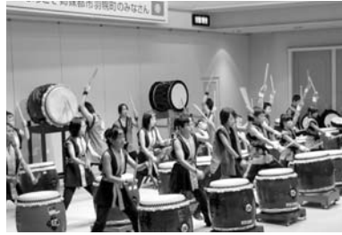
内灘町役場1階町民ホールで行われた和太鼓合同演奏会。朝から練習に励んだ甲斐もあり、本番では多くの内灘町民を魅了しました。

平成14年1月 内灘町制施行40周年記念式典に出席するため羽幌町長・羽幌町議会議長が内灘町を訪問。