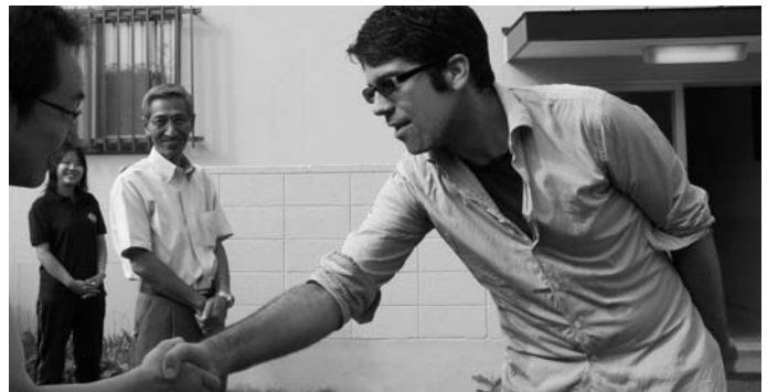
8月22日朝、親しくしていた方々や関係者に見送られ、元気に出発しました。