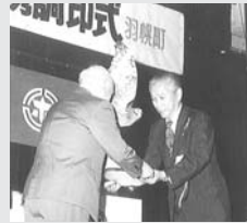
調印を記念して内灘町長から鷹の置物が贈られる。