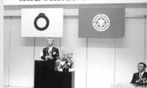
式典で式辞を述べる舟橋町長

平成12年7月 姉妹都市提携20周年記念式典並びに祝賀会が内灘町で行われる。羽幌町長・羽幌町議会議長ら一行18名が内灘町を訪問。