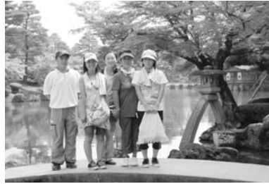
兼六園のシンボルとして知られる二本脚の「徹軒灯籠」をバックに記念撮影。