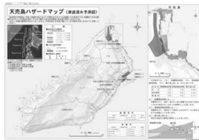
天売島ハザードマップ

羽幌川、築別川の標高と周囲の土地を比べ、地盤の低い区域を河川はん濫などの危険区域とし、土砂災害危険箇所及び避難所等を表示しています