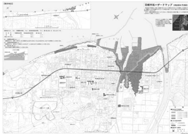
羽幌市街ハザードマップ(津波浸水予測図)

津波発生時の市街・築別地区の危険区域と、土砂災害危険箇所及び避難所等を表示しています