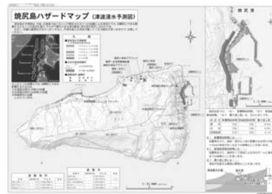
焼尻島ハザードマップ