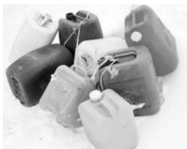
☺今年1月にサンセットビーチ周辺に漂着していたポリ容器