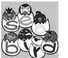
第7回海鳥デザインコンテスト オロロン鳥部門 | オロロン鳥賞受賞作品