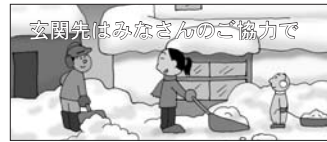
玄関先はみなさんのご協力

雪出しは、交通事故の原因となり非常に危険です。また、歩道に物を置くと、除雪作業の障害になります。