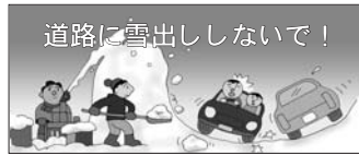
道路に雪出ししないで！

路上駐車は、除雪作業の障害になり円滑な作業の妨げになります。また、交通事故の原因にもなります。