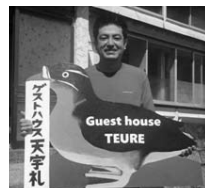
ウトウの看板が目印です！ ホームページ⇒ゲストハウス天売で検索して下さい。

夏に何度か旅行に来ていたこともあり、島のごことは知っていたつもりでしたが、初めて過す冬の厳しさや、春の草花たちの装い、秋の満天の星雲など、本当に新しい発見の毎日でした。今でこそ地域おこし協力隊という制度も有名になりましたが、私が来た3年前は、まだまだ知られていませんでした。 羽幌が私が初めての協力隊というところもあり、先輩や同僚もおらず、私も初めは戸惑いながらの活動でした。 そのような中で、まずはこうして3年間やり遂げて最後の挨拶ができていくという状況を有り難く思います。そして任期満了後もゲストハウスの運営のため、島に定住して活動をして行くという道筋を見いだすことができました。広報4月号、6月号でゲストハウス開業に向けてのお知らせをしてきましたが、ついに、7月1日初日からお客様も入り、思い出に残る新しい門出となりました。7月の3連休やウエ祭りなども、おかげさまでご利用くださる方もおり、段々ではございますがゲストハウスの存在も認知されてきたのでは