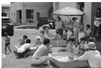
うさこちゃん遊びの広場