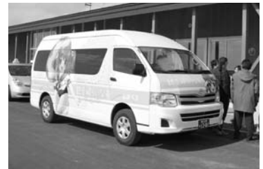
【シャトルバス】 定員13名の小型バス。車体には、沿岸バスの「萌えっ子フリーきっぷ」のアニメ風美少女キャラクターの一人「観音崎らいな」が描かれています。