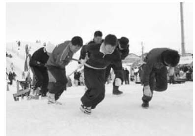
おろろんウィンターフェスティバル