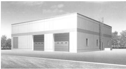
汚水処理施設イメージ図