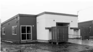
平成23年度から建替が始まった幸町団地