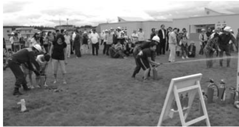
平成25年度の防災訓練