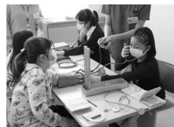
道立病院「キッズセミナー」