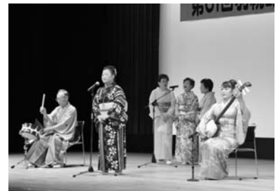
町民芸術祭(舞台部門)