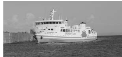
フェリー「おろろん2」