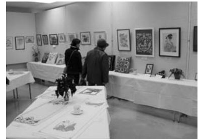
町民芸術祭(展示部門)

文化賞体育賞顕彰式、優良青少年顕彰式を開催し、文化・体育・ボランティアなどで活躍した功績を顕彰します。