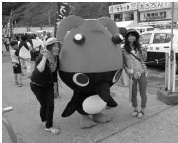
羽幌町のPRキャラクター「オロ坊」 さまざまなイベントに登場して人 気を集めています。