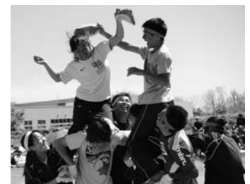
天売島民大運動会