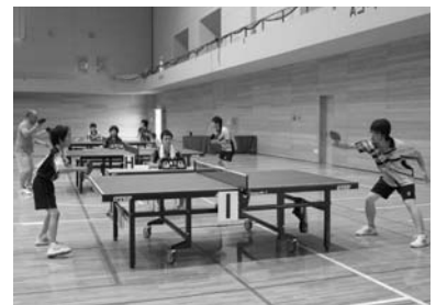
少年少女卓球大会兼町民健康卓球大会