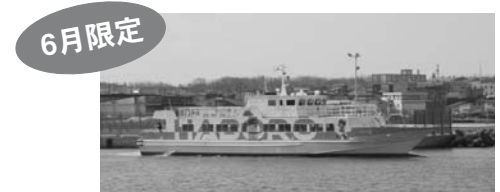
高速船「さんらいなあ2」