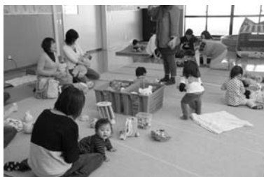
乳幼児育児教室「あいあいサ〜クル」