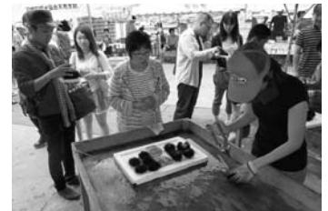
天売ウニまつり(平成25年度)