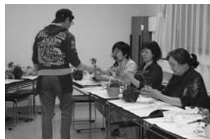
ガーデニング講座

成人を対象にゴルフ、陶芸など技術、技芸教室を開催し学習や体験を通じて知識や技術を習得する場を提供し、自ら学ぶ生涯学習のきっかけとなる事業です。