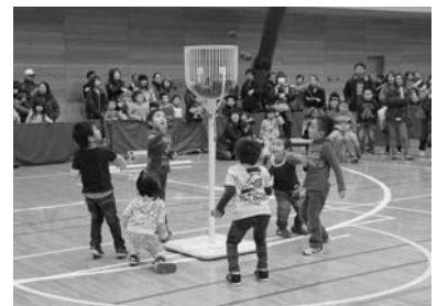
パワデールフェスティバル