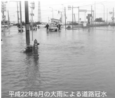
平成22年8月の大雨による道路冠水

このため、これまでの警報の発表基準をはるかに超える異常な現象が予想され、重大な災害の起こるおそれが著しく大きい場合、特別な警戒を呼びかける「特別警報」を新たに発表します。 特別警報が発表された場合、これまで経験したことのないような非常に危険な状況です。命を守るため最善の行動をとりましょう。